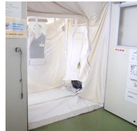
設備の導入イメージ（簡易陰圧装置）