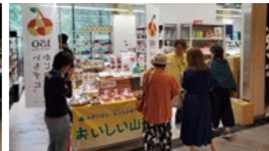
2階の全国アンテナショップでの山形フェア

問い合わせ ◎ 県名古屋事務所 名古屋市中区栄4-1-1 中日ビル5階 ☎052-265-9841