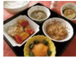
飲み込みやすいよう調理した嚥下食