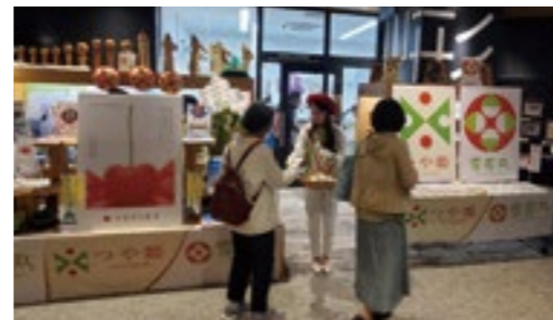
5階の県名古屋事務所前の観光情報コーナー

これらの環境を生かし、中日ビル開業直後のゴールデンウィークには県産米「つや姫」「雪若丸」、さくらんぼ「やまがた紅王」のPRイベントを実施したほか、6月には全国アンテナショップと連携して「初夏のおいしい山形フェア」を開催しました。日々の活動の中で、本県の農産物や、旅行先としての山形が中京圏で着実に浸透してきていることを実感しています。