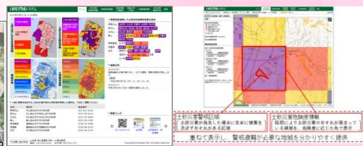
県ホームページによる防災情報提供 (山形県土砂災害警戒システム)