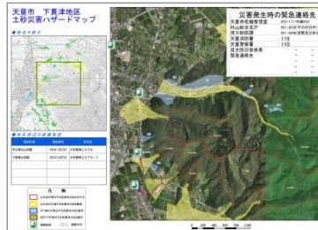
土砂災害ハザードマップの掲示