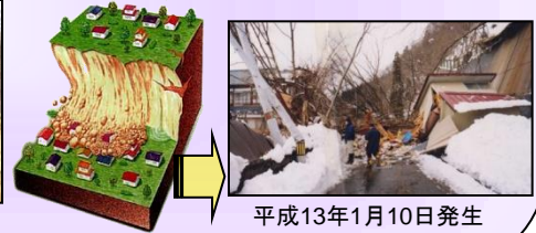
平成13年1月10日発生 寒河江市白岩(がけ崩れ)