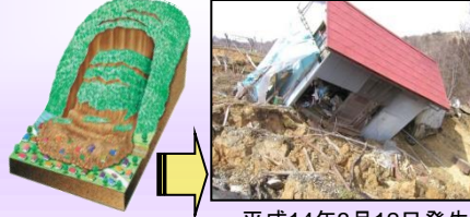
平成14年3月12日発生 朝日町大谷(地すべり)