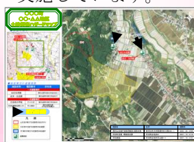
土砂災害ハザードマップ