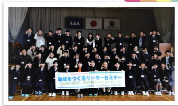
(令和5年度のセミナーの集合写真 左：庄内会場 右：内陸会場)