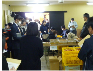
（株）いにしえ（天童市）の作業場

その後の研修会では、参加者が意見交換を行い、交流を深めました。今後も「農福連携」の取組みを進めていきます。