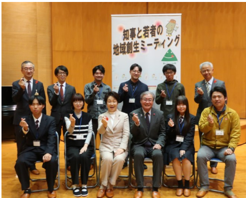
● in河北町 参加者のみなさん