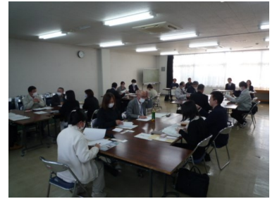
研修会（天童市農業センター）