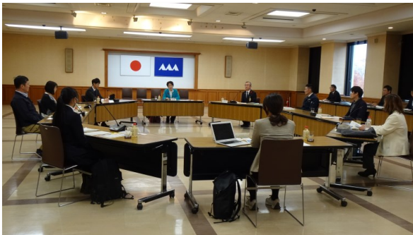
● 村山創生懇談会の様子