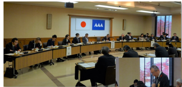
東南村山地域議員協議会