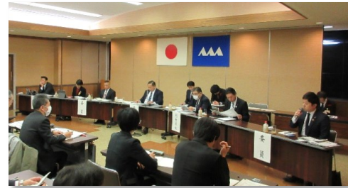
西村山・北村山地域議員協議会