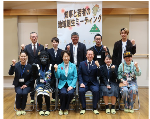
● in上山市 参加者のみなさん

知事は、「皆さん上山愛が強く、上山を盛り上げていこうという意気込みを感じた。上山市、そして山形県の活性化に向けて一緒に地域を盛り上げていきましょう。」と呼び掛けました。