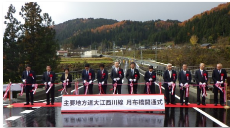
● テープカットの様子