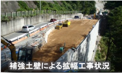
補強土壁による拡幅工事状況