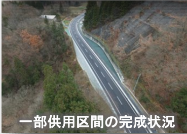
一部供用区間の完成状況

朝日町大字杉山地区で進めている一般国道287号の道路改築事業杉山工区のうち、完成した区間約320mを部分供用しました。