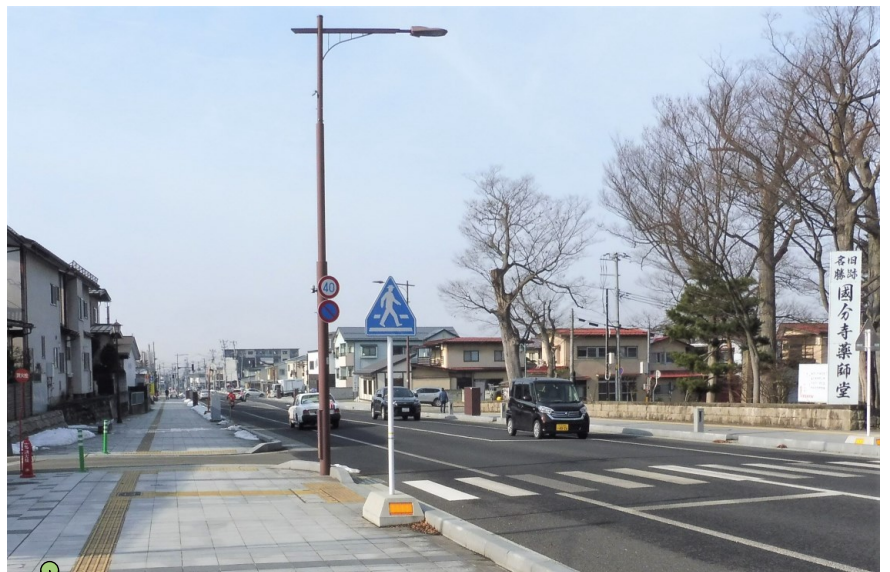
▲薬師公園前の様子(事業完了後)