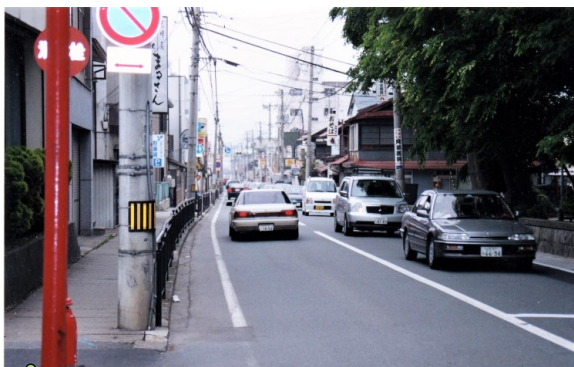
▲薬師公園前の様子(事業着手前)