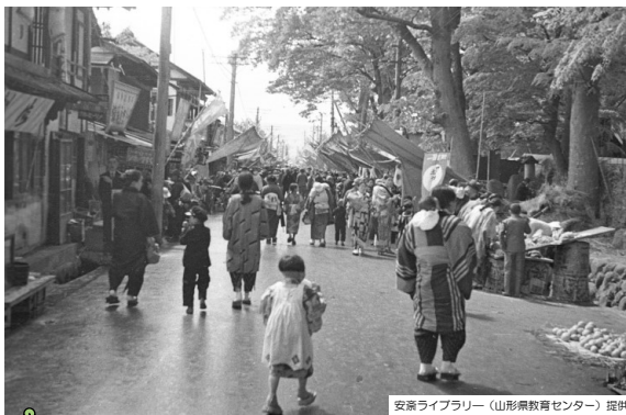
▲戦前の薬師公園前「植木市」の様子