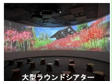
大型ラウンドシアター

(伝統と四季の叙景詩)の公開や、慈恩寺のことを楽しく学べるクイズラリーなど、大人から子どもまで楽しむことができます。このほか「寺そば・寺カフェ」では、朝パフェなどのおしゃれなメニューや、こだわりのそばなどが堪能できます。ぜひ皆さん、足を運んでみてはいかがでしょうか。