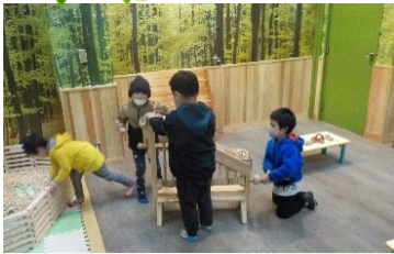
オープニングイベント（木育ひろば）

「県民の森」は、4月29日（昭和の日）に今年のシーズンが始まりました。四季折々の沢山の企画を用意して、皆様のお越しをお待ちしております。