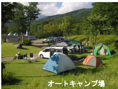
オートキャンプ場

運動不足やストレス解消に、ご家族やご友人と一緒に公園の散策やキャンプなどはいかがでしょうか。