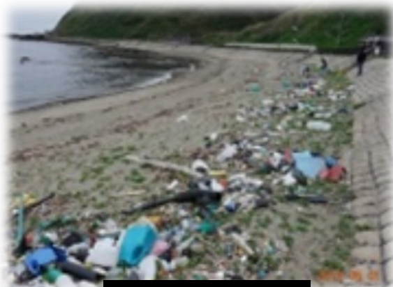
海岸漂着ごみ(鶴岡市)