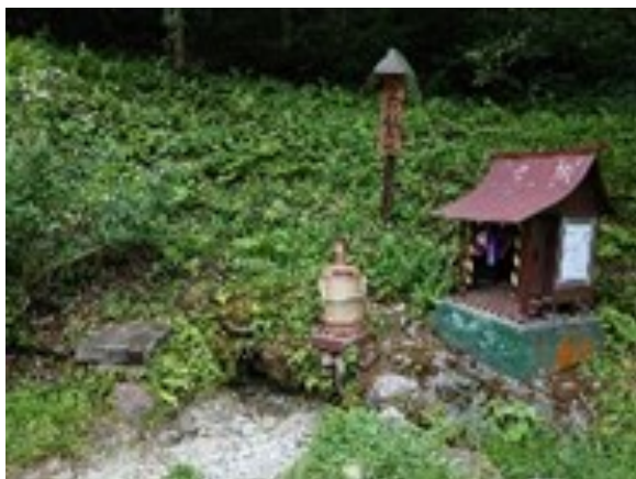
黒伏観音水（東根市）

県では、地域の人々に育まれてきた優れた湧水を「里の名水・やまがた百選」として選定し、情報発信しています。村山管内では、風間御不動様の清水（山形市）など24か所が選定されています。