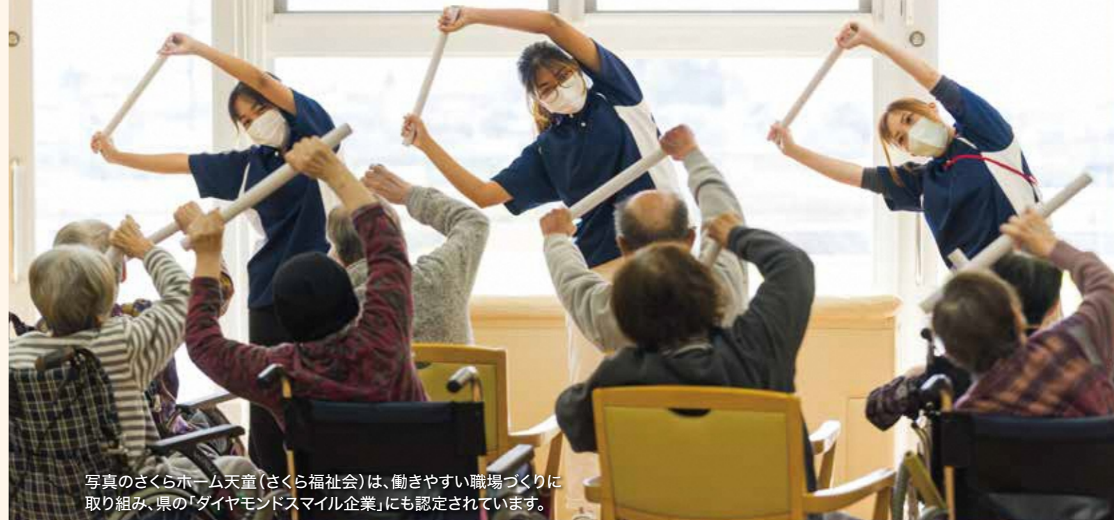
写真のさくらホーム天童(さくら福祉会)は、動きやすい職場づくりに取り組み、県の「ダイヤモンドスマイル企業」にも認定されています。

高齢者一人ひとりがいきいきと安心して暮らせる山形県を目指し、県では介護サービスを支える人材の確保に取り組んでいます。