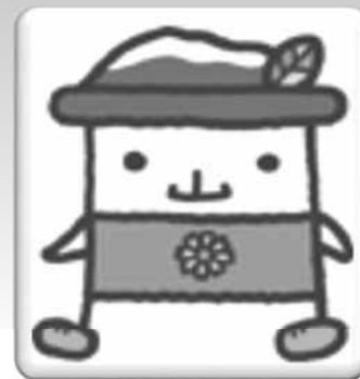
西川町イメージキャラクター 「ガッさん」