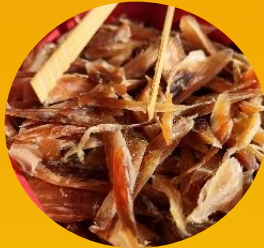
おつまみにぴったり 鮭トバ