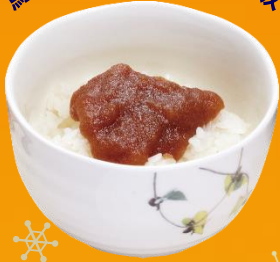
寒鱈汁によく合う 鱈の子醤油漬けご飯