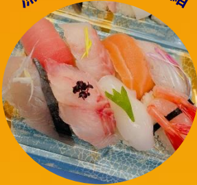
漁協の新鮮握り鮭