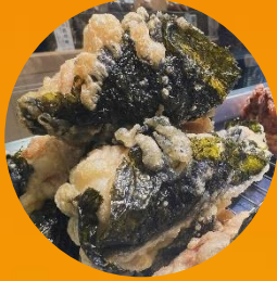
庄内で大人気 白子の天ぷら