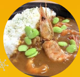
エビとスパイスが マッチ紅エビカレー