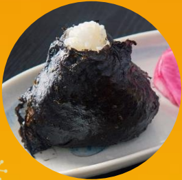
磯の香広がる 岩海苔おにぎり