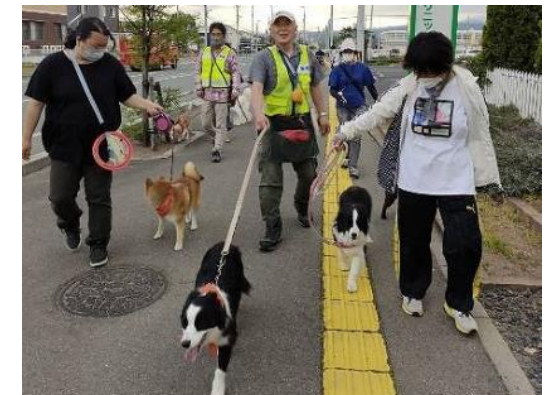
愛犬の散歩を通じた認知症サポーターによる見守り活動 認知症のシンボルカラーオレンジ色のバンダナが目印