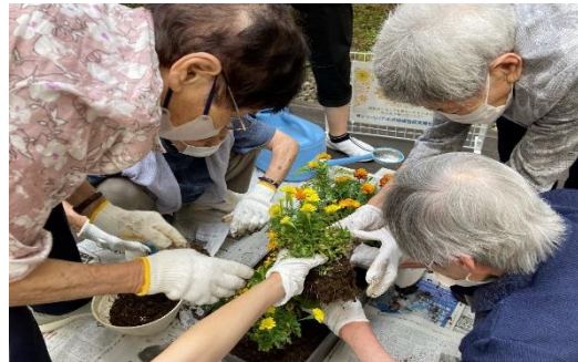
認知症の人も参加して市役所などにオレンジ色の花を植える活動