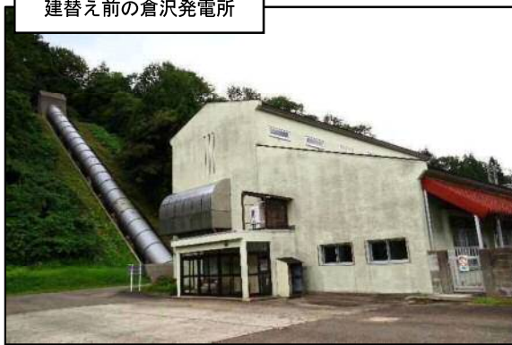
建替え前の倉沢発電所