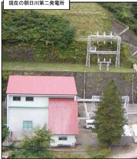
現在の朝日川第二発電所