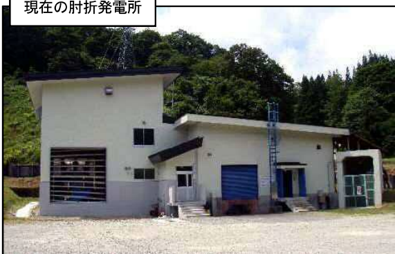
現在の肘折発電所