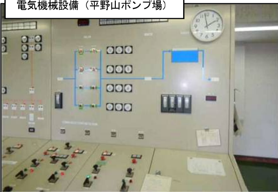
電気機械設備（平野山ポンプ場）