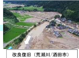
改良復旧（荒瀬川/酒田市）