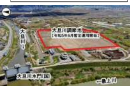
河川整備（大旦川/村山市）