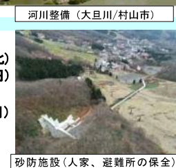
砂防施設（人家、避難所の保全）