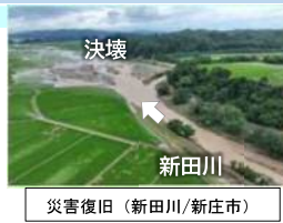
災害復旧（新田川/新庄市）