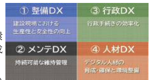
建設DX推進戦略 4つの柱

高校生等を対象とした大工職人の魅力を伝えるセミナーの開催、若手大工の技能習得に対する支援