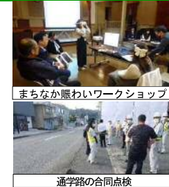
まちなか賑わいワークショップ