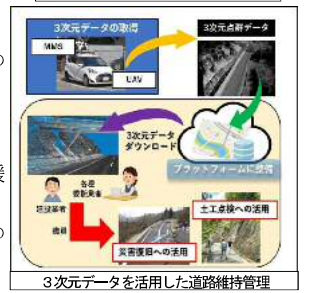
3次元データを活用した道路維持管理