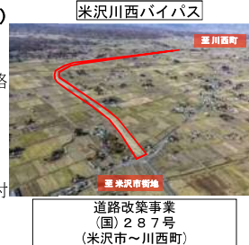
道路改築事業（国）287号（米沢市～川西町）