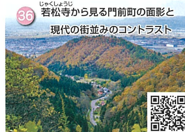
36 じゃくしょうじ 若松寺から見る門前町の面影と 現代の街並みのコントラスト