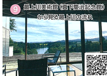
9 最上川美術館(真下慶治記念館) から見る最上川の流れ