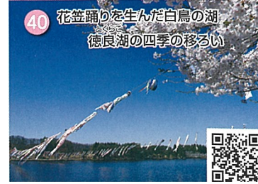
40 花笠踊りを生んだ白鳥の湖 徳良湖の四季の移ろい