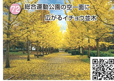
72 総合運動公園の空一面に 広がるイチヨウ並木