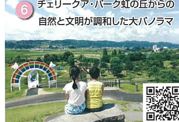
6 チェリークア・パーク虹の丘からの 自然と文明が調和した大パノラマ