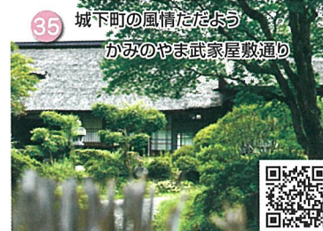
35 城下町の風情たどよう かみのやま武家屋敷通り