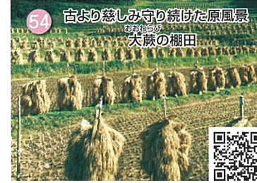
54 古より慈しみ守り続けた原風景 大蔵の棚田