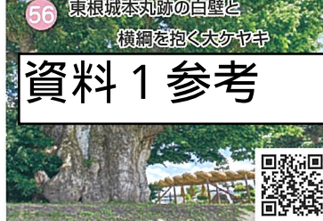
56 東根城本丸跡の白壁と 横綱を抱く大ケヤキ