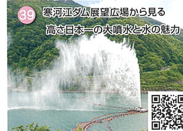
39 寒河江ダム展望広場から見る 高さ日本一の大噴水と水の魅力