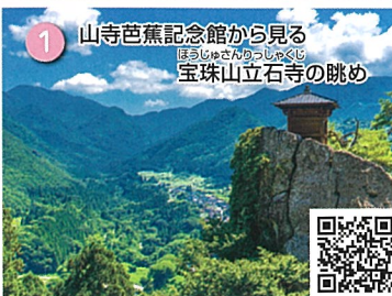
1 山寺芭蕉記念館から見る 上山城天守閣から見る 宝珠山立石寺の眺め