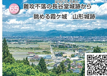
65 難攻不落の長谷堂城跡から 眺める霞ヶ城 山形城跡