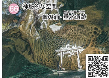
66 神秘的な空間 葎の浦・垂水道跡