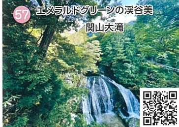
57 エメラルドグリーンに 映える関山大滝