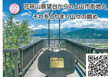
69 花咲山展望台からの上山市街地と それをとりまく山々の眺め