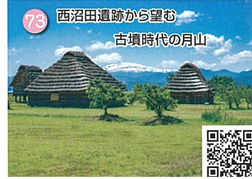
73 西沼田遺跡から望む 古墳時代の月山