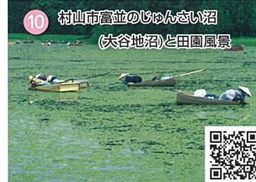
10 村山市富並のじゅんさい沼 (大谷地沼)と田園風景