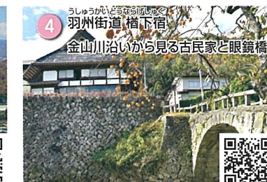
4 うしゅうかいどう 羽州街道 橋下宿 金山川沿いから見る古民家と眼鏡橋