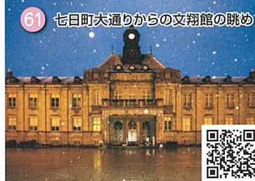
61 七日町大通りからの文翔館の眺め