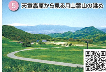
5 天童高原から見る月山葉山の眺め