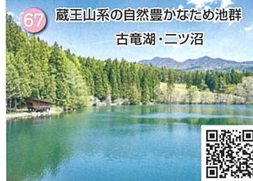
67 蔵王山系の自然豊かなため池群 古竜湖・ニッ沼