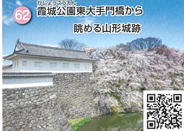
62 霞城公園東大手門橋から 眺める山形城跡