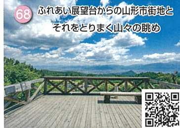
68 ふれあい展望台からの山形市街地と それをとりまく山々の眺め