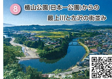
8 橋山公園(日本一公園)からの 最上川と左沢の街並み