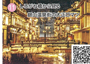
11 しるがね橋から見る 鎮山温泉街の大正ロマン