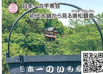
63 日本一の芋煮会 初代大鍋から見る唐松観音