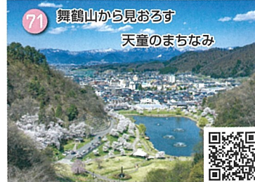
71 舞鶴山から見おろす 天皇のまちなみ