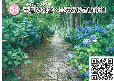
64 出塩文殊堂へ登るあじさい参道