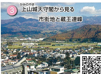
3 かみのやま 上山城天守閣から見る 市街地と蔵王連峰