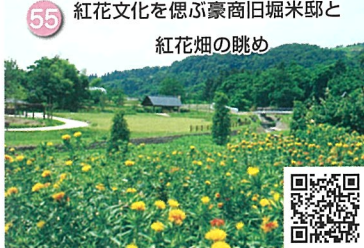
55 紅花文化を偲ぶ豪商旧堀米邸と 紅花畑の眺め