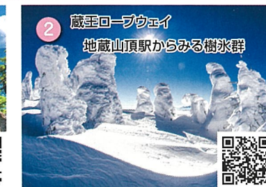
2 蔵王ロープウェイ 地蔵山頂駅からみる樹氷群