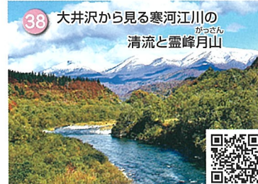
38 大井沢から見る寒河江川の 清流と霊峰月山