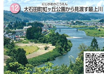
12 大石田町虹ヶ丘公園から見渡す最上川