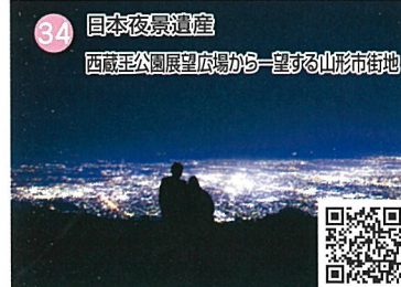
34 日本夜景遺産 西蔵王公園展望広場から一望する山形市街地