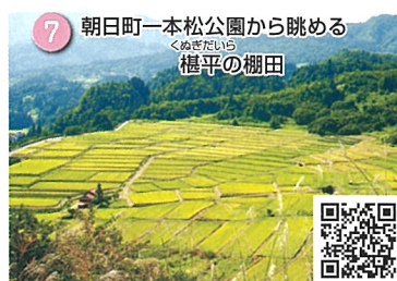
7 朝日町一本松公園から眺める くぬぎだいら 榎平の棚田