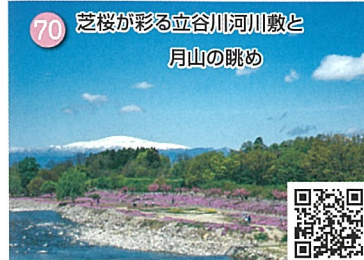
70 芝桜が彩る立谷川河川敷と 月山の眺め