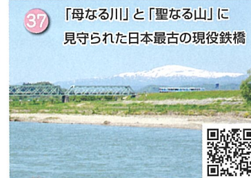
37 「母なる川」と「聖なる山」に 見守られた日本最古の現役鉄橋