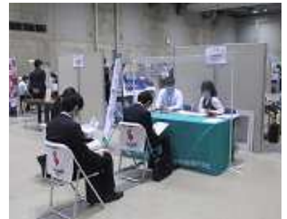
熱心にメモをとり説明を聞いていました

自粛要請により就職活動を十分に行うことができず、不安を抱えた学生にとって、企業と直接会って話しを聞くことで、「 村山地域の企業の魅力 」を知っていただくと同時に、「 山形県で働きたい 」と思っただけの契機となったのではないのでしょうか。