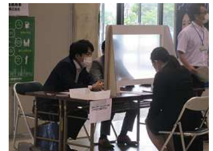
積極的に質問をしていました