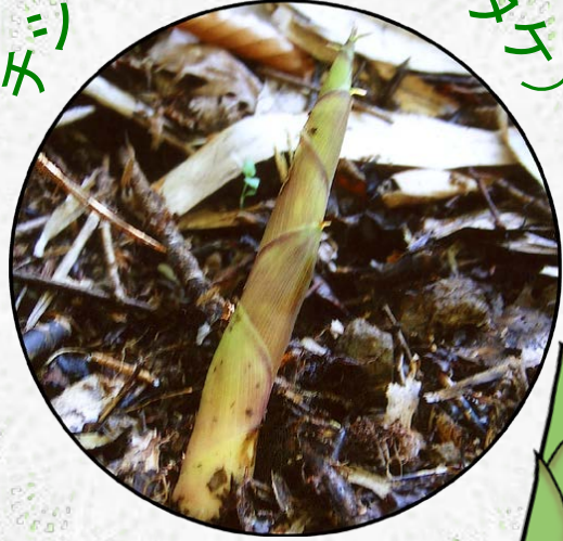
ホシマザサ(ネマガリタテ)