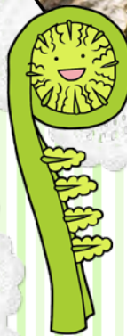
キヨタキシダ(赤コゴミ)