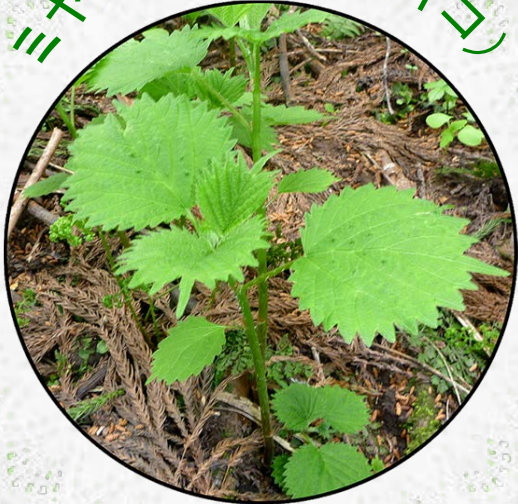
ニヤマイラクサ(アイコ)