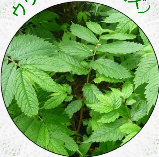
ウワバミソウ(赤ミズ)