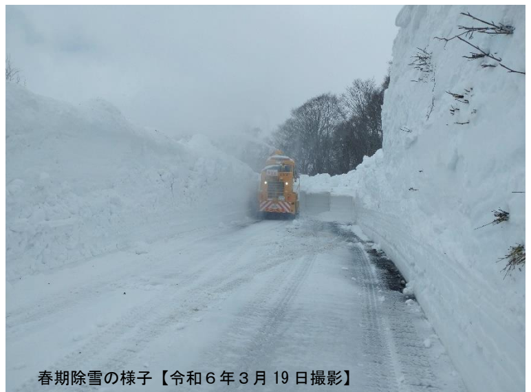
春期除雪の様子【令和6年3月19日撮影】