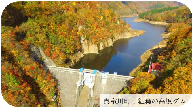
真室川町：紅葉の高坂ダム