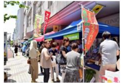
「出張!新庄・最上漫画ミュージアム」と観光PRも実施