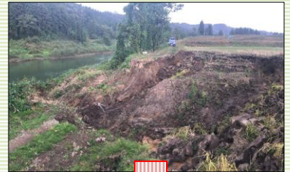
舟形町水田・農道