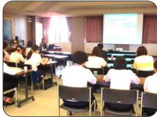
[子ども家庭支援課 29-1361]