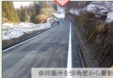
※同箇所を別角度から撮影