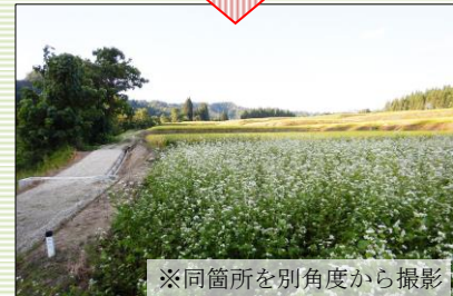
※同箇所を別角度から撮影