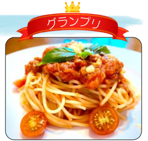
超簡単絶品トマト缶 ツナ缶パスタ