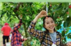
フルーツ・ツーリズム (さくらんぼ狩り体験)