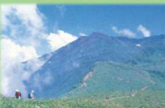
山岳ツーリズム (鳥海山トレッキング体験)