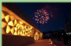
スノーツーリズム (月山志津温泉 「雪旅籠の灯り」)