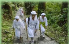
精神文化ツーリズム (出羽三山山伏修行体験)