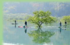
アドベンチャーツーリズム (白川湖水没林でのSUP体験)