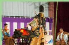
歴史ツーリズム (黒川能「水焰の能」)