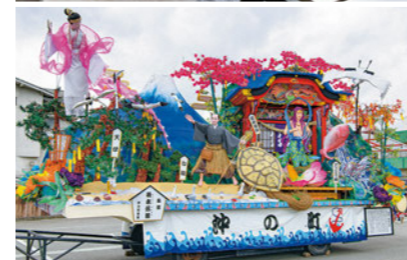
ユネスコ無形文化遺産登録 新庄まつり

食では、山菜やそば、伝承野菜が有名です。肘折・赤倉・瀬見などの温泉、義経や芭蕉ゆかりの地、最上川峡の絶景、金山町の美しい街並みなど豊かな観光資源にも恵まれています。