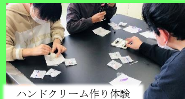
ハンドクリーム作り体験