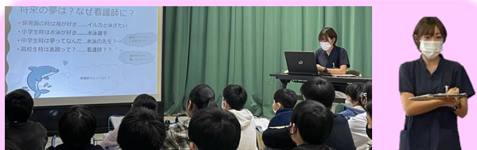
看護師による講話体験 (バイタルサインの説明)

児童の皆さんからは、「知らなかった仕事を知ることができて良かったです。」「どの職業も仕事内容を知らなかったけど、体験してみて、どのようにするのか具体的に分かりました。」などの感想が寄せられました。