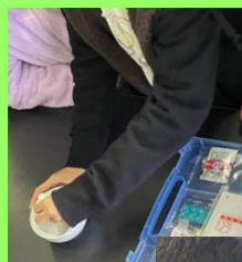
薬剤師による講話と体験 (薬剤調合、軟膏練り)