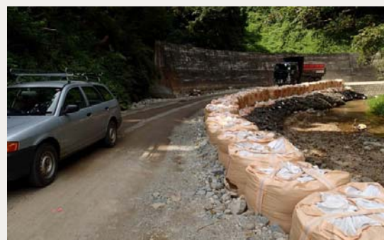
応急道路の整備が完了した(主)米沢南陽白鷹線

県ホームページ>置賜総合支庁>建設総務課>置賜地域豪雨災害復旧情報 http://www.pref.yamagata.jp/ou/sogoshicho/okitama/325071/gouusaigai.html