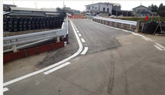
仮橋の整備が完了した吉野橋(9月29日時点)