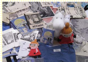
Tampere Art Museum Moominvalley

ミュージアムショップには、展覧会限定のオリジナル商品をはじめ、国内のムーミングッズを多数取り揃えています。