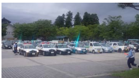
明るいやまがた夏の安全県民運動川西町出発式

み苦しむ人も多いと聞き、どうにかならんかなと思ひ、始めた朝夕のパトロールでした。