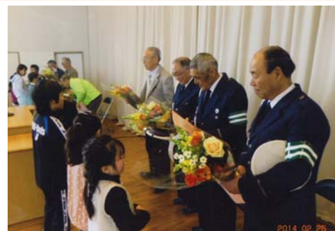
西部小学校 青パト・立哨感謝の会

この青パトの「絆」が、地域全体へ、そして市民総参加の機運に育っていけば、事故ゼロの日も夢ではないと思ひながら、これからも活動を続けてまいります。