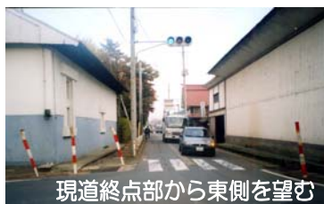
現道終点部から東側を望む

開通に先立ち、地元関係者等により安全祈願祭がとり行われ、地域全体で安全な通行を祈願していただきました。