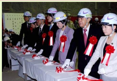
山形側での貫通発破

この(仮称)栗子トンネルの貫通により、東北中央自動車道の整備促進に弾みがつき、平成29年度の供用開始への期待が益々高まってきました。