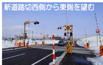
新道踏切西側から東側を望む