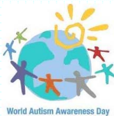
World Autism Awareness Day