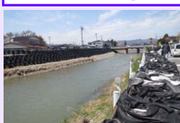
改修を待つ吉野橋付近

建設部では、昨年、一昨年と二年続けての大雨により、南陽市を中心に浸水などの被害をもたらした河川の改修を行うため、昨年度に河川砂防課の中に設けた改良復旧担当をさらに拡充し、今年度から県南豪雨災害復興推進室を開設しました。吉野川復旧事業・災害関連事業及び織機川災害関連事業に注力し、また、県道米沢南陽白鷹線も大きな被害を受けたことから、道路復旧と一体となって両河川の復旧・復興をさらに推し進めているところです。工事が本格化して参りますので、ご協力をお願いいたします。(建設部)