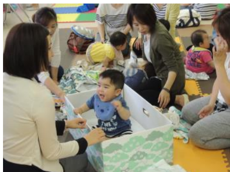
9か月検診時のニーズ調査の様子 (写真のBoxはフィンランド製)

さらに、このBoxは、市内の妊婦さんには無償で配布しますが、市外にはふるさと納税の返礼品として進呈や首都圏の伊勢丹デパートなどでの販売を通して、地域の産業振興も目指しています。