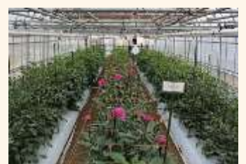
ダリアの長期出荷を可能にしたハウス抑制栽培技術

南陽市宮内にある産地研究室では、野菜と花に関する新しい栽培技術の開発に取り組んでいます。野菜では、アスパラガス、えだまめ、しょうが等の産地支援のため、高品質・安定生産技術の開発を行っています。花では、ダリアの品質保持技術の開発や、アルストロメリア、リンドウ、ストック等の地域に適する栽培方法の検討を行っています。置賜地域の気候をうまく活用して、野菜と花の高品質生産とブランド化を図り、農業の発展につながる技術開発を目指しています。(農業技術普及産地研究室)