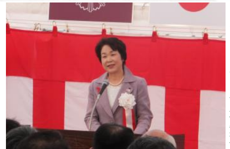
あいさつする吉村知事

置賜総合支庁では、開通に合わせ、イベントや各市町・各種団体等と連携して様々なPR活動や誘客対策