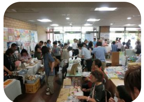
バザーの様子(西置賜地域振興局)