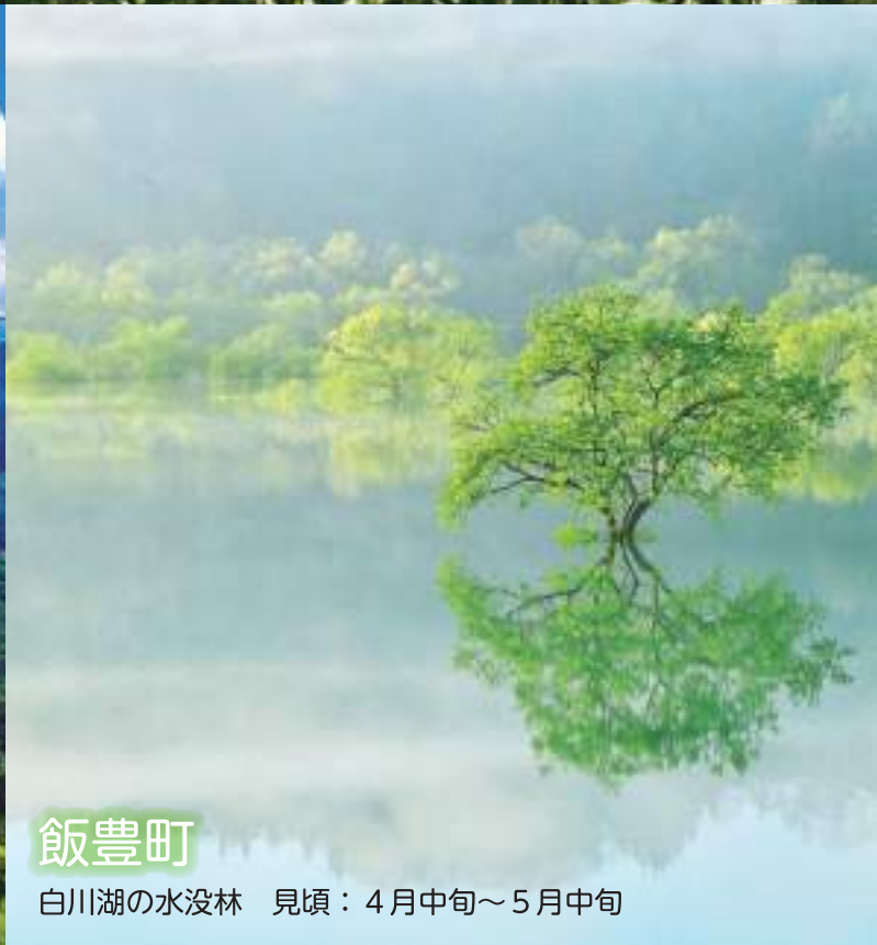
飯豊町 白川湖の水没林 見頃：4月中旬～5月中旬

「みづは」とは水の神様のこと。飯豊・朝日両連峰に降り積もった雪は、雪どけとともに無数の 沢水となり、置賜野川、置賜白川から最上川へ、また横川、玉川から荒川へと合流し、 やがて日本海に注ぎます。 ※「みづは」の「みづ」は「みず(水)」の古語