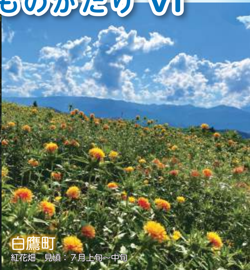
白鷹町 紅花畑 見頃：7月上旬～中旬