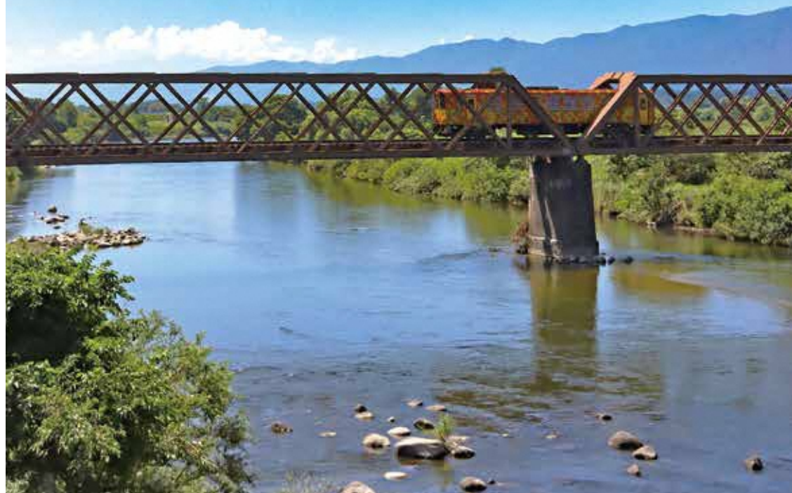
表紙「最上川と荒砥鉄橋、山形鉄道フラワー長井線」