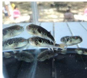
放流するトラフグの稚魚

庄内浜で漁獲される魚の稚魚を放流し、資源維持に取り組んでいます。トラフグの稚魚を放流する参加者を募集しています。