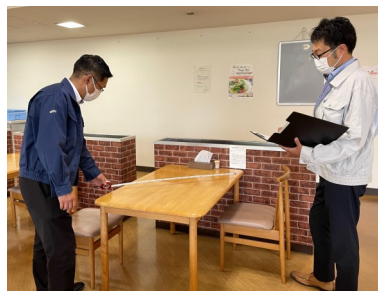
認証基準を満たしているか担当者による施設確認を行っています