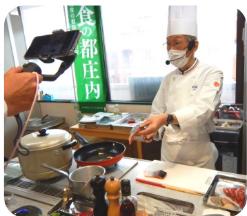
オンライン交流会での太田親善大使