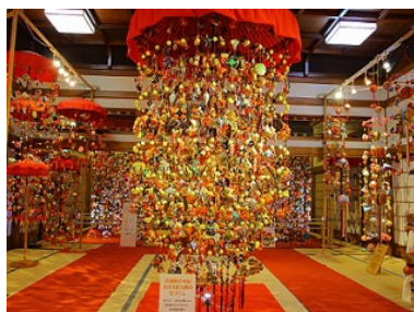
傘福 (山王くらぶ所蔵)

3月から約1か月のあいだ、管内の致道博物館や本間家日本邸などの観光施設で雛人形が展示されます。江戸時代に北前船を通じ京都など上方からもたらされた雅な雛人形や、日本三大つるし飾りの一つ