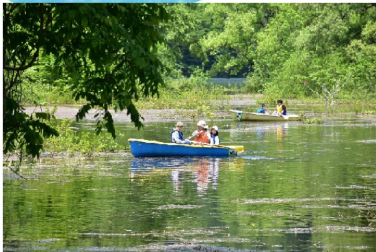
水没林を眺めながらのボート遊覧

5月26日、タキタロウまつりが鶴岡市大鳥のタキタロウ公園で開催されました。当日は天気にも恵まれ、約5,000人の来場者で賑わいました。今年も荒沢ダムでは、管理用のトンネル探検とダムの資料展示見学のイベントを行いました。トンネル探検では、昭和30年完成のレトロな雰囲気と、傾斜45度・高低差30mほどの急階段のアップダウンを参加者に楽しんでいただきました。