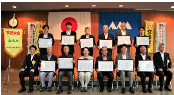
交通安全功労者表彰受賞者(10名、2団体)