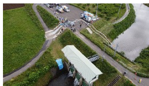
国土交通省と合同の排水訓練 (5月29日)