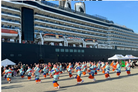
花笠演舞によるふ頭でのおもてなし

4月から5月にかけて、酒田港に外航クルーズ船が6回寄港し、延べ1万3千人以上の乗客・クルーがおいでになり、オプションツアーなどで多くの方が庄内エリアの観光地を周遊しました。