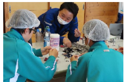
職業体験会「WAKU WAKU WORK」