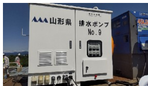
可搬式排水ポンプ

梅雨・台風時期は土砂災害が増加します。「土砂災害から身を守るための3つのポイント」(右欄QRコード)を確認し、土砂災害に備えましょう。