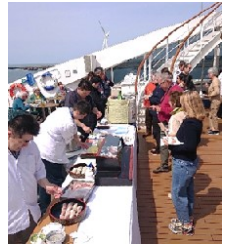
船内での 庄内産食材のPR