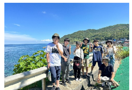
若者「庄」学校フィールドワーク