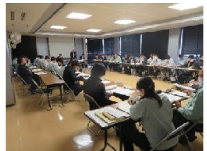
第1回作物担当者会議 45名参加 (5月29日)