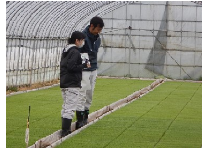
普及課独自の育苗巡回。つや姫マスターと苗の生育状況を確認(4月25日)

農業技術普及課 作物担当 ☎ 0235-64-2103 酒田農業技術普及課 作物担当 ☎ 0234-22-6521