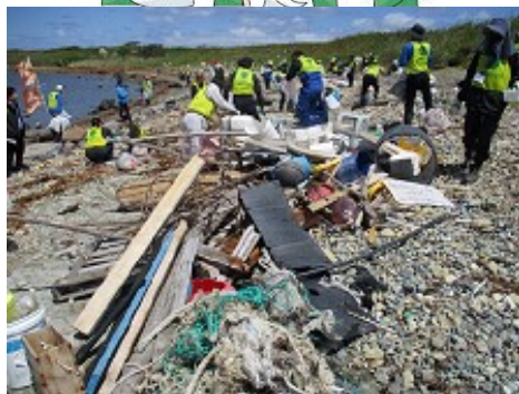
飛島クリーンアップ作戦 (5月25日)