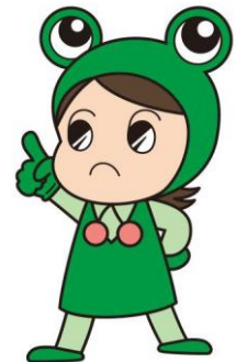
山形県消費生活センター キャラクター ケロちゃん