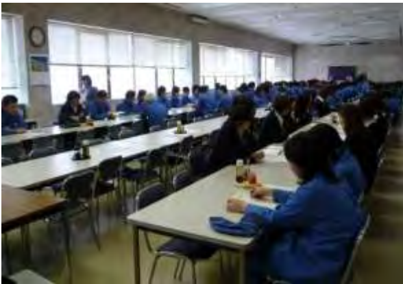
「がん予防講座」の様子

また、健康増進事業としてボウリング大会を開催するなど、従業員の体力づくりにも力を入れているとのこと。