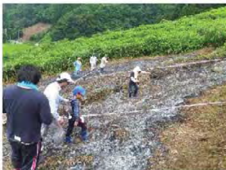
種まきの様子(ほんとにバラバラ程度)