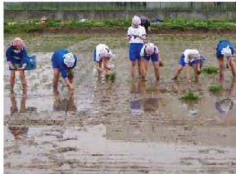
楽しく話をしながら