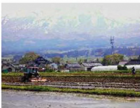
代かき作業の場所もあります