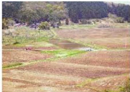
中山間地では遅れ気味