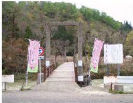
かたくり園入り口(吊り橋です)