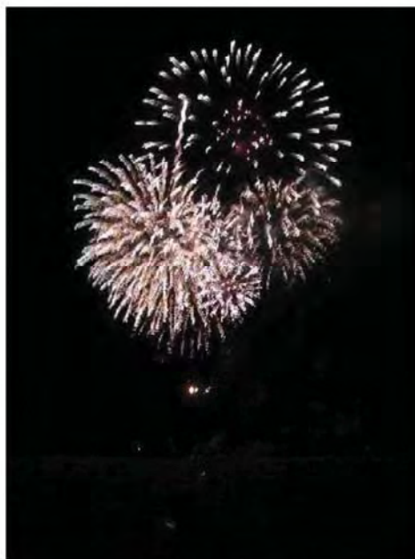
実際はとても綺麗でした。

岩手、宮城、福島の方々にもこの声援が届いてほしいと願い、屋台の焼き鳥を脇目に、グッと我慢し家路についた私です。