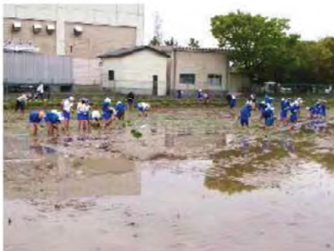
天候にも恵まれました