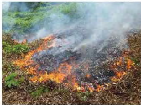
焼いている様子(近づくと暑い)

お盆にかけて、この焼畑は続きます。また、鶴岡市内で作られている「藤沢かぶ」もお盆後くらいに行なわれますので、ダイエットしたい方など、見学にいらしてはいかがでしょうか。