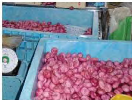
冬にはこのように美味しい漬物になります