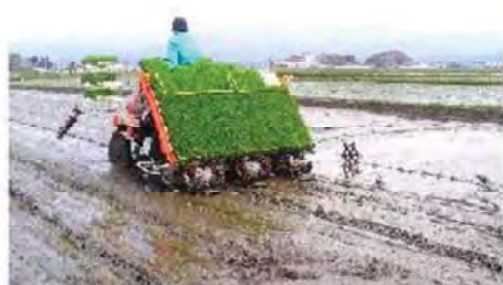
田植えが始まりました

今年のはなかなか気温も上がらず、また、融雪も遅れたことで中山間部は農作業が例年よりも遅れ気味のようです。苗や水の管理、畑や果樹の作業と重なったりと、農家の方はこれからも大変な日々が続きますが、頑張ってもらいたいと思いました。