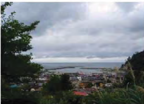
加茂神社からの眺め