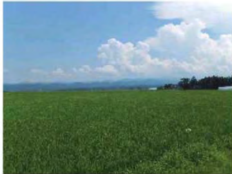
入道雲もモクモクと

川に脚を入れているだけで少し涼しくなれます。海やプールに行ったり、 仲のいい友達と互いの家を行き来しながら、楽しく節電したいと思います。 (SPF50 PA+++でしっかりガードよ！)