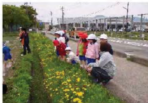
園児の声援もありました