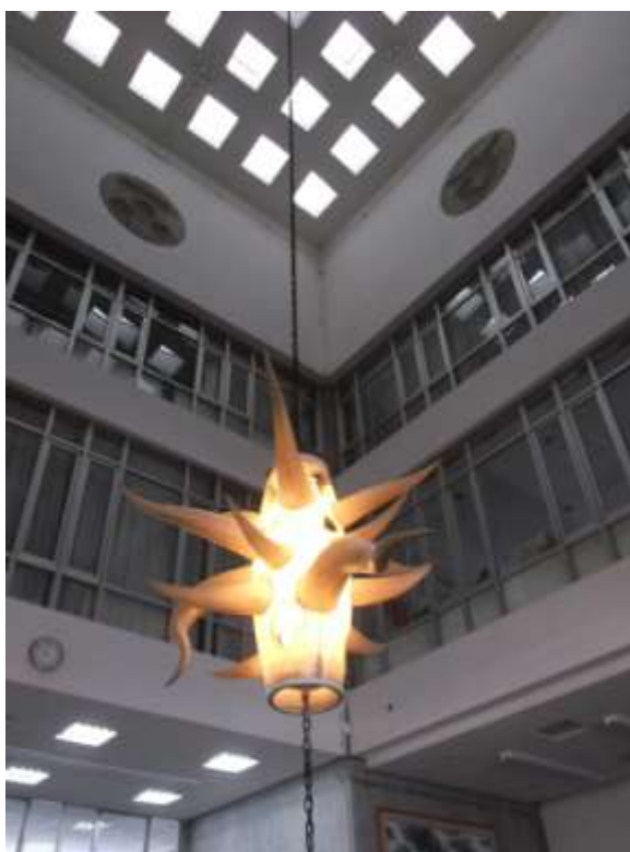
内観（2階から見上げ）・岡本太郎氏の彫像「生誕」