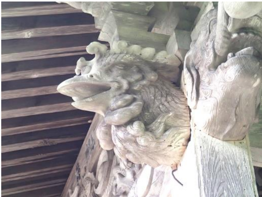
向拝 鳳凰木鼻(右側)