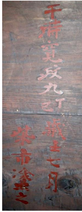
観音堂宮殿 壁墨書