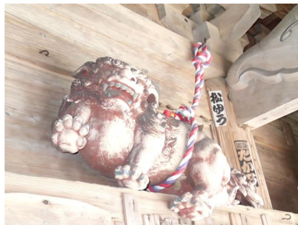
長押上の獅子(町指定)