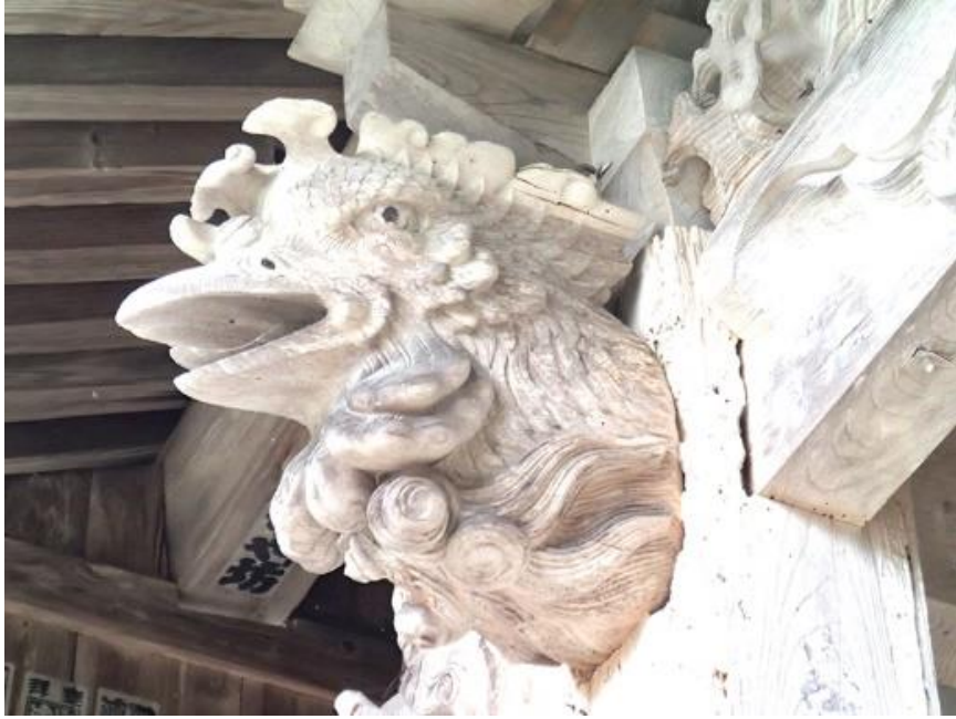
向拝 鳳凰木鼻(左側)