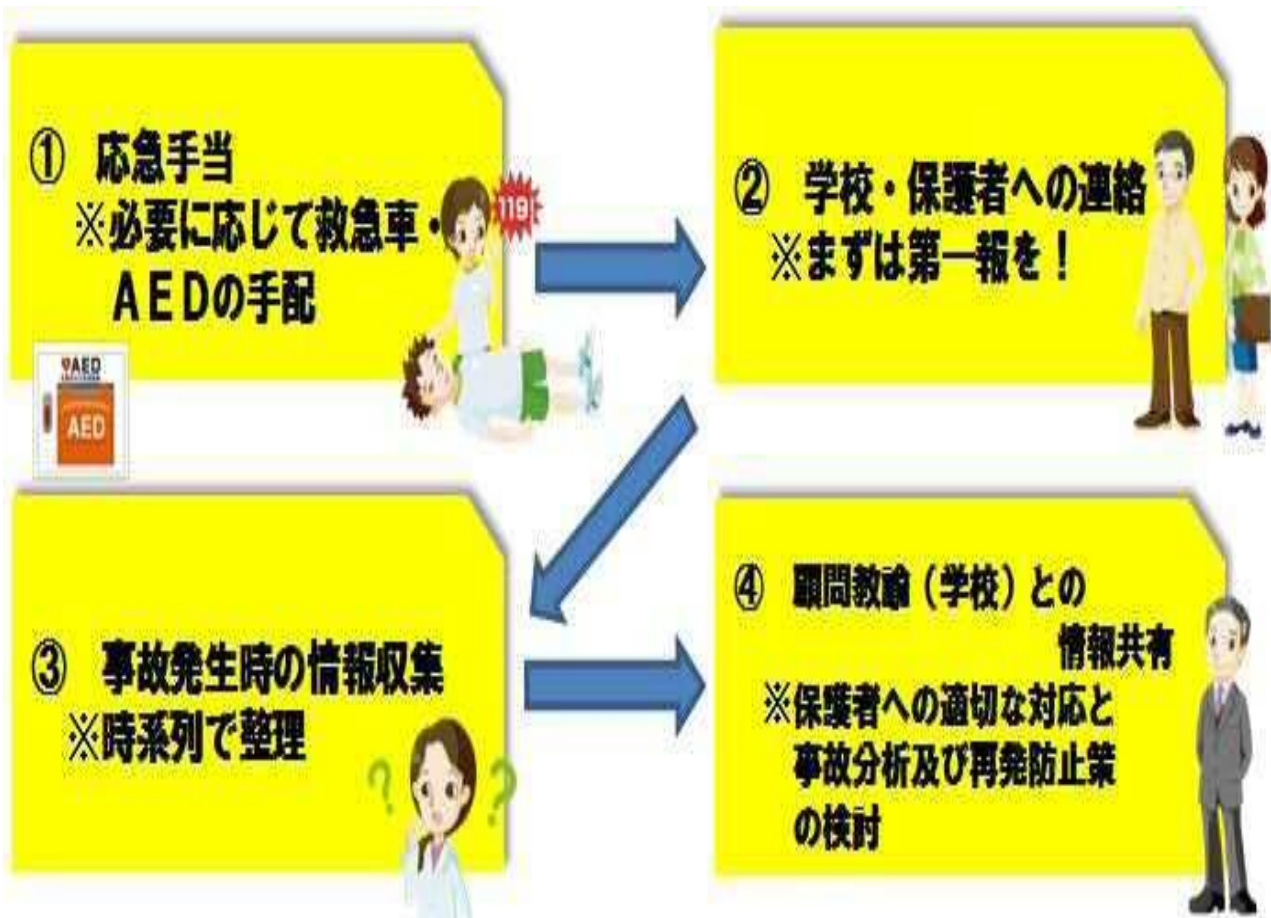
(参照 1) 事故発生時の連絡体制の図