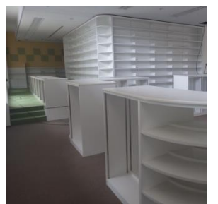
工事中のこどもエリアの状況