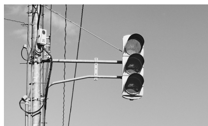
写真1 たて 縦型の信号機

ひろし：信号機は、縦型が多いね。山形県は、どこでも縦型なの。東京の信号機は横型だよ。 お父さん：山形県の信号機の多くは、縦型だね。 かおり：どうして山形県と東京ではちがうのかな。 お父さん：おそらく山形県と東京の気候のちがいが大きな理由だと思うよ。ここ米沢市と東京の気候を比べるとしたら、何を調べるといいかな。