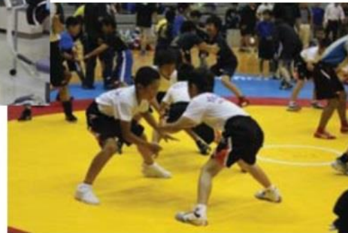
次世代メダリストの育成