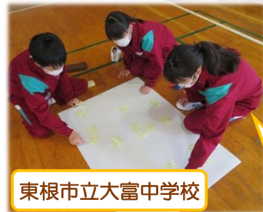
東根市立大富中学校

この講座で、尾花沢市ボランティアサークル「風ぐるま」を紹介しました。その存在を知り、両校から16名が新たに入会し、現在、地元尾花沢市を中心に活動中です。