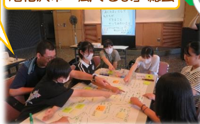
尾花沢市「風ぐるま」総会