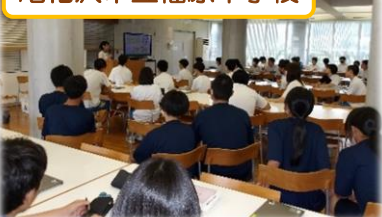
尾花沢市立福原中学校