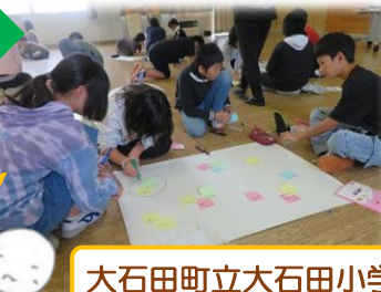
大石田町立大石田小学校