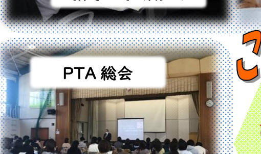
学校・地域・PTA 会議