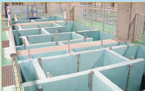
水をゆっくり上下に流して、フロックを大きくします。