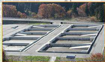
泥を屋外で自然乾燥させる。