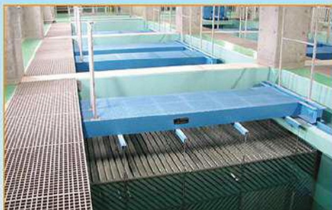
大きくなったフロックを洗めます。