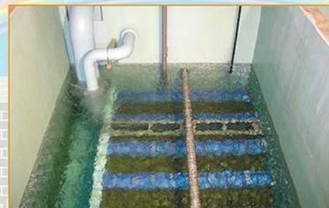
洗まなかった小さなフロックを砂でろ過します。