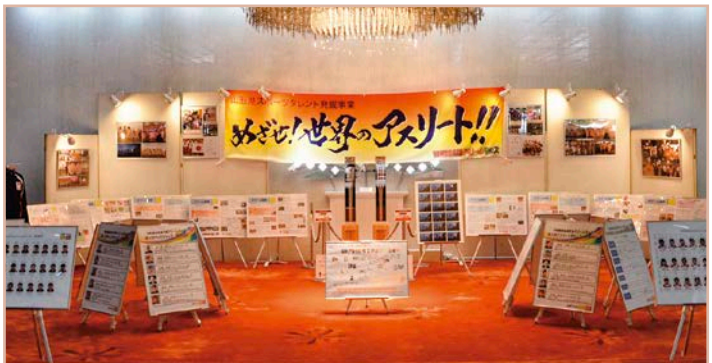
▲ オリンピックにちなんだYAMAGATAドリームキッズの展示