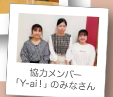
協力メンバー 「Y-ai!」のみなさん