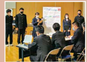
米沢興譲館高校(活動発表の様子)