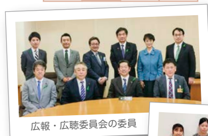
広報・広聴委員会の委員