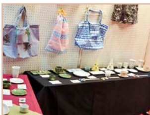
▲ 上山高等養護学校の作品の展示