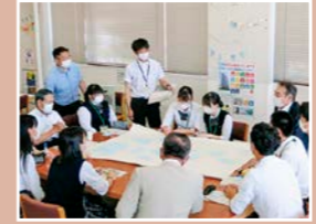
庄内農業高校(グループワークの様子)