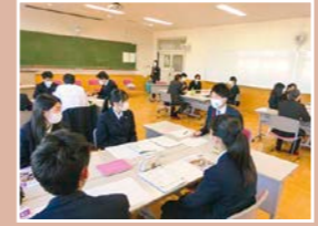
米沢東高校(グループワークの様子)